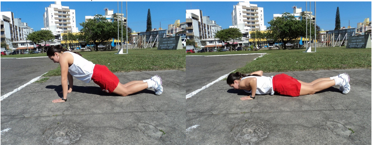
Foto 11: Posição Inicial e Final ( Posição “um”) -Visão Lateral Foto 12: Posição “Dois” - Visão Lateral